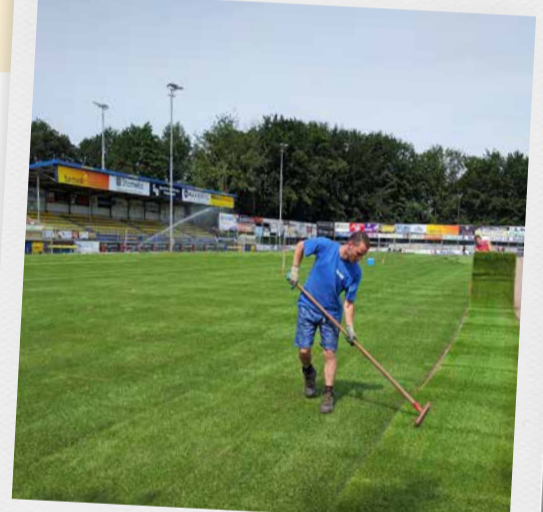
Renovatie sportveld VV Staphorst